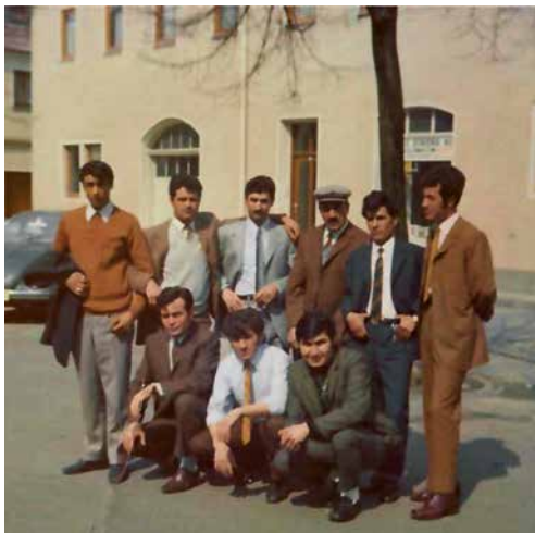
Türkische Arbeitsmigranten auf dem Karlstadter Kirchplatz, 1970

Die Ausstellung des Bezirks Unterfranken zeigt beispielhaft Geschichten aus unterschiedlichen Epochen und macht deutlich, dass Mobilität und Migration seit Jahrhunderten prägende Elemente unserer Gesellschaft sind.