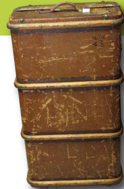
Der Überseekoffer mit zahlreichen Erinnerungen stammt aus dem Heimatmuseum Ebern.

ArbeitsmigrantInnen, die in den Jahren des Wirtschaftswunders nach Deutschland kamen, unterstützten den wirtschaftlichen Aufschwung. Heute gestalten Zugezogene aus vielen verschiedenen Nationen unsere Gesellschaft mit.