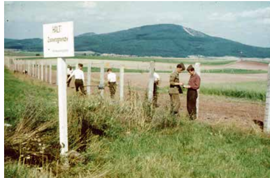
Die innerdeutsche Grenze, die mit den Jahren immer stärker ausgebaut wurde, zerriss Verwandtschafts- und Freundschaftsbande und führte zu zahlreichen Fluchtereignissen.