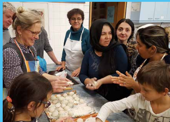
Afghanischer Kochabend in Hofheim

Waren es im 7. Jahrhundert irischschottische Wandermönche, die sich in Unterfranken niederließen, gab es nach der Reformationszeit protestantische Glaubensflüchtlinge, welche die Entwicklung zahlreicher Gemeinden prägen.