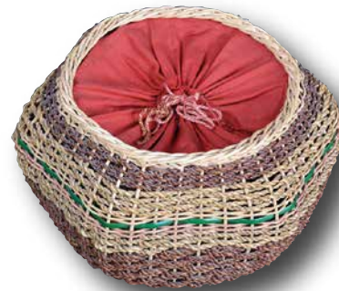
Das Handarbeitskörbchen stammt aus dem Besitz einer Familie aus dem Sudetenland, die sich nach der Vertreibung 1947 in Karlstadt niederließ.