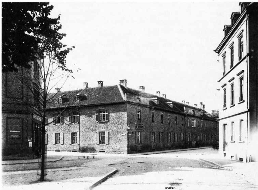
Städtisches Krankenhaus um 1912. Die hier in der Bildmitte liegende Ecke Lamprecht-/Werbachstraße wurde 1927/28 abgerundet (Vorlage: Stadt- und Stiftsarchiv Aschaffenburg).

Dies ist leider nur zu sehr wahr; es giebt Dienstherrschaften – man muß dies aus den geschilderten Thatsachen wenigstens annehmen, auch ist ein thatsächlicher Fall bekannt –, die notorisch Kranke vielleicht aus Gutmüthigkeit in ihren Dienst nehmen, damit solche dann nach Anmeldung sich sofort ins Krankenhaus begeben können, um sich kuriren zu lassen.