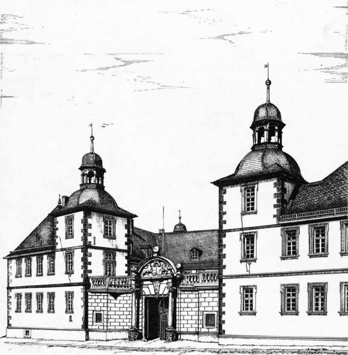
Haupteingang Schönborner Hof

(Zeichnung: Rainer Erzgraber, Aschaffenburg)