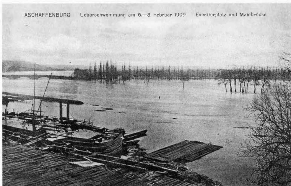
Ansichtspostkarte des Hochwassers 1909.

Der nächste markierte Hochwasserstand trägt das Datum 8. Februar 1909. Einsetzendes Tauwetter hatte den Main innerhalb von fünf Tagen bis auf 6,91 Meter anwachsen lassen. Er führte losgerissene Flöße, große Mengen von Holz und ertrunkenes Kleinvieh mit sich. Wie bei den bisher beschriebenen Hochwassern waren Teile der Straßen nach Darmstadt, zum Schönbusch, nach Großostheim und am Mainufer der Stadt überschwemmt. Die auf dem Kleinen Exerzierplatz zerlegt lagernde Aschaffener Militärschwimmschule war vom Hochwasser mainabwärts mitgenommen worden 20 . Der Magistrat