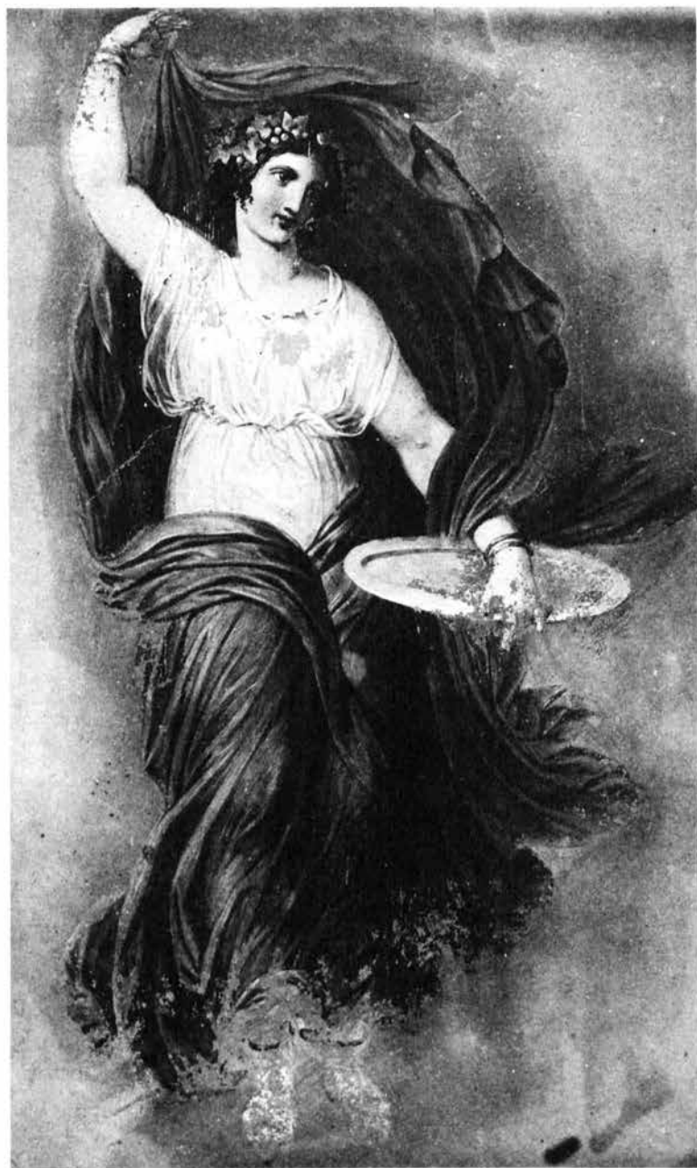
Wandbild im Pompejanum, Fresko, um 1848; Zustand von 1894, vor der Restaurierung durch Adalbert Hock