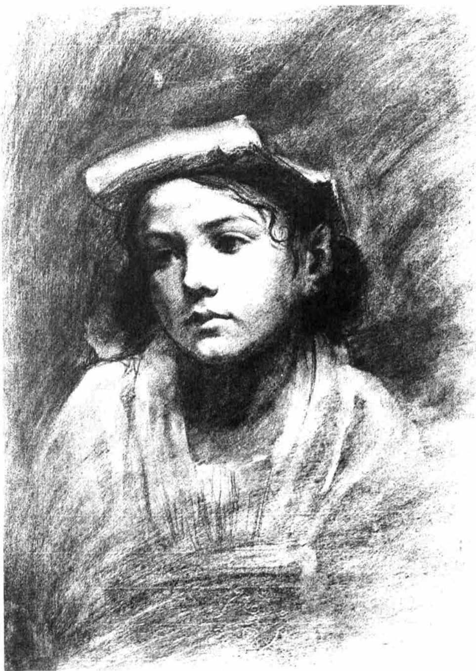
Zeichnung, Kohle, 1892, von Adalbert Hock