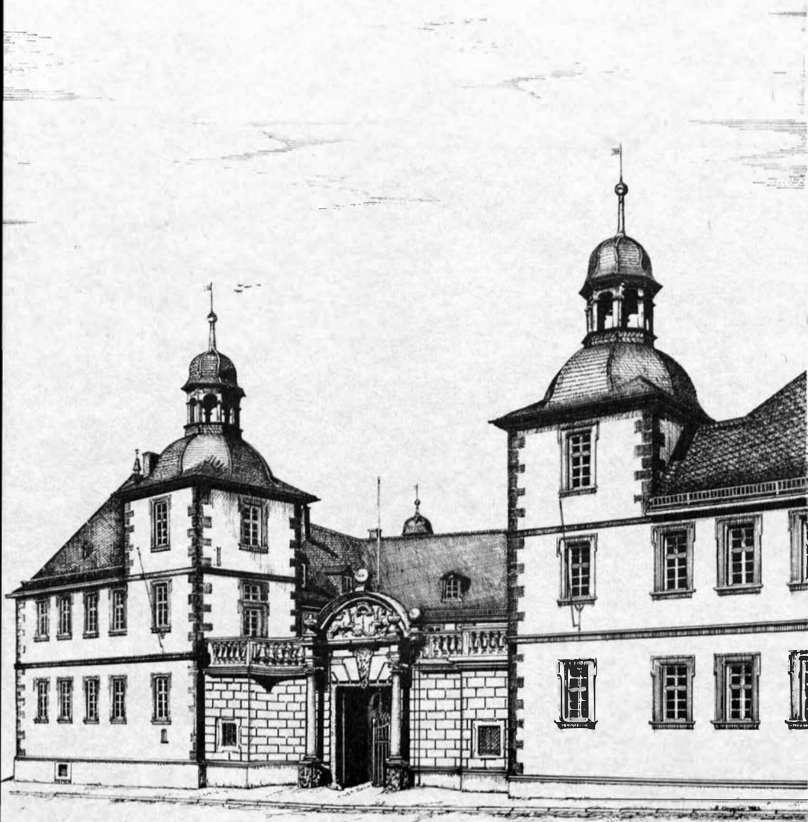
Haupteingang Schönborner Hof

(Zeichnung: Rainer Erzgraber, Aschaffenburg)