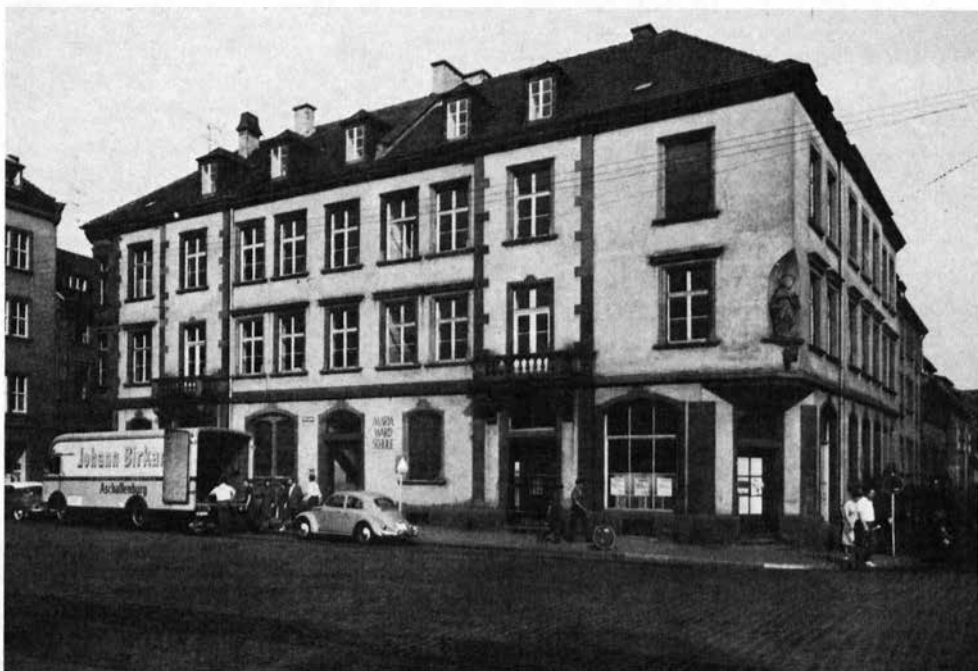
Marktplatz 2—4

1962 Umzug des Archivs aus der Villa Desch in das Gebäude der ehemaligen Maria-Ward-Schule am Marktplatz.