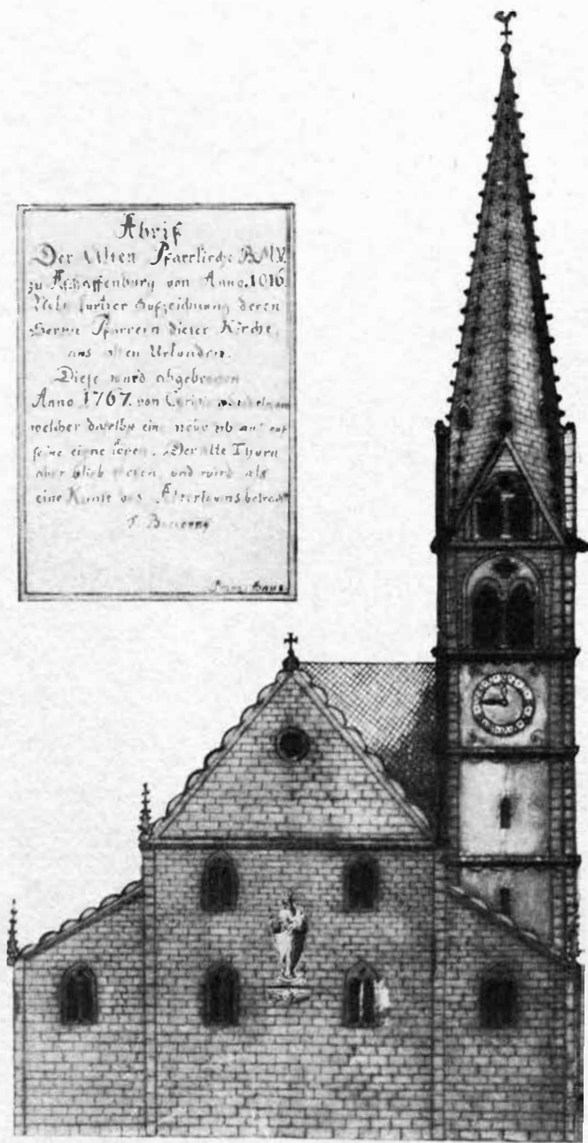
„Die alte Pfarrkirche“, Zeichnung von Glöckner Franz Haus

Abriß Der Alten Pfarrkirche zu zu Köffenburg von Anno. 1010. Nach further Aufzeichnung deren Herrn Sperrers dieser Kirche aus alten Urkunden. Diese ward abgebrochen Anno 1767 von Carl v. d. G. v. d. G. welcher davor ein neues ab zu seine eigene Idee. Der alte Thurm aber blieb stehen und wurde als eine Kunst des Alterthums betrachtet. F. Glöckner